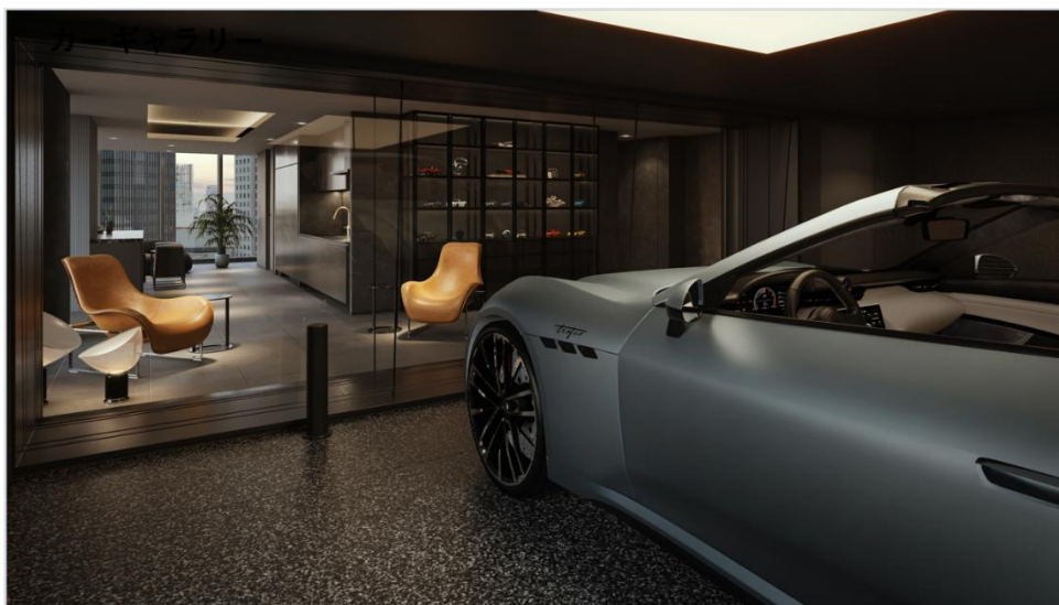
カーギャラリー付き住戸 イメージ