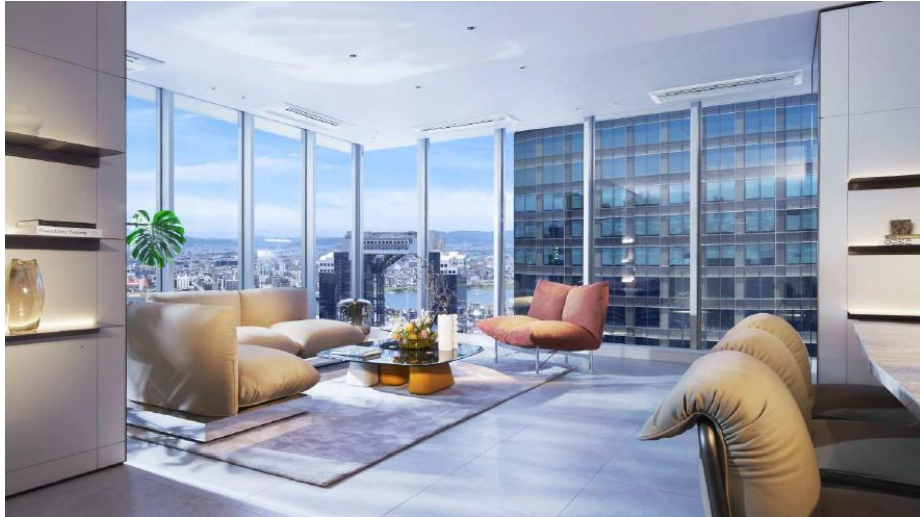
フルハイトサッシを全面窓に使用した高層階の居室 イメージ

当レジデンスの設計コンセプトは「THE SUITE 空と対話する」です。より軽やかに、より開放的に、空とのつながりを感じる住まいを目指しました。その象徴となるのが、新たに開発した床から天井まで届くフルハイトサッシです。当レジデンスでは、全面窓を多用したデザインに加え、このフルハイトサッシを採用することで、室内と外の境界をできる限り薄くし、視界の広がりを見事に最大限に生かし、日々の暮らしを、どこかスイートルームのような特別な体験へと引き上げます。