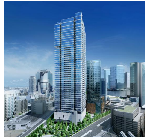
自然と都市機能が調和するグラングリーン大阪の「南街区」に立地 イメージ